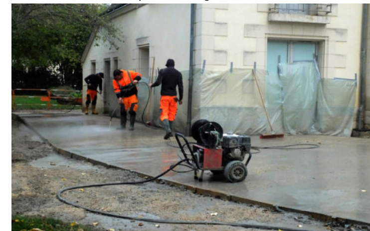
Désactivation du béton