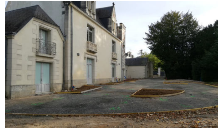
Délimitation des espaces à végétaliser

Attendons maintenant le printemps pour voir le résultat final !